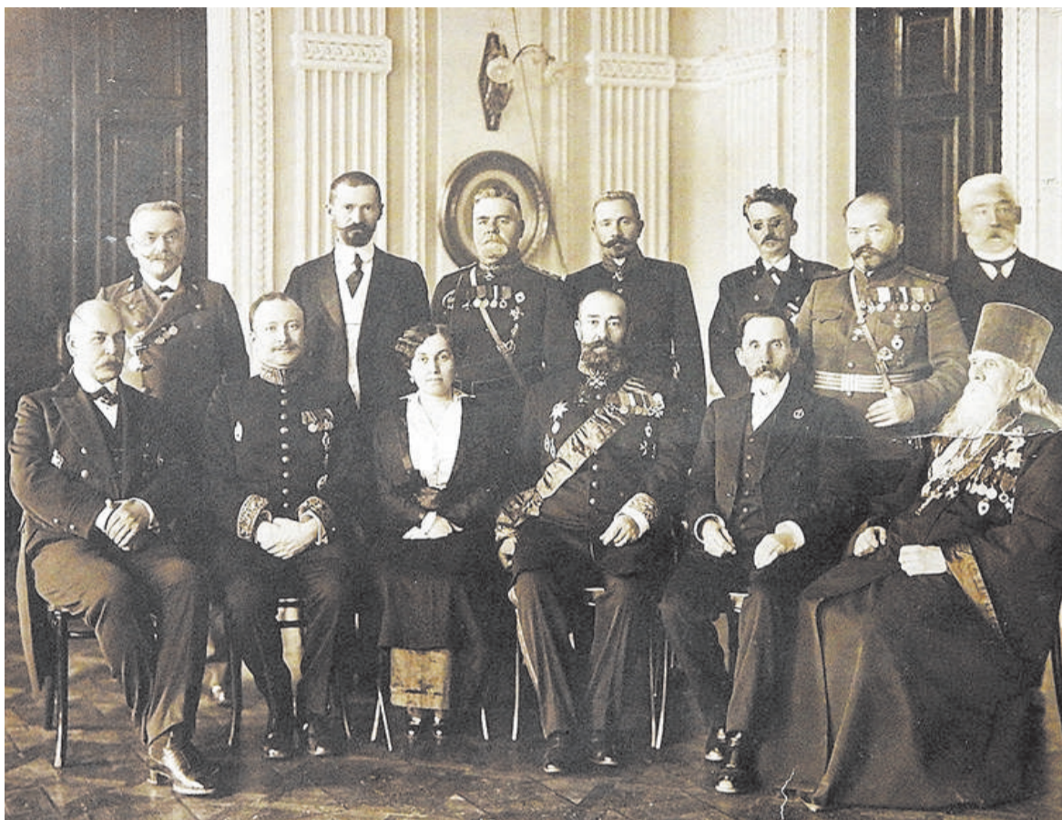
Протоиерей Симеон Никольский.

светлом, сияющем от утешения лице ее. Богослужение совершалось торжественно, на сколько это в данном случае было возможно, согласно указу св. Синода от 20 февраля 1840 года (Практ. руковод. для священносл. И. Нечаева. Спб. 1890 г., стр. 160-162). Литургия закончилась пением, соборным при предстоятельстве о. настоятеля прихода, благодарственного Господу Богу молебствия с многолетствованием: «христианского благочестия ревнителю, защитнику и покровителю Христовы церкви Благочестивейшему Самодержавнейшему Великому Государю нашему Императору Николаю Александровичу, Самодержцу Всероссийскому и иных стран Государю и Обладателю и всему Царствующему Дому; св. Синоду и Преосвященнейшему Архипастырю нашему Агафодору, епископу Ставропольскому и Екатеринодарскому с его богохранимою паствою и всем православным христианам». В 12-ть часов дня православный народ, ликуя, как в светлый день Пасхи, расходился по обширной станице в свои дома. Не могу не отметить и другую утешительную особенность отношений церковного причта и православного народа к святому делу миссии. Простите, Преосвященнейший Владыко! «От избытка сердца говорят уста» (Мф. XII, 34). - Во время причастного стиха о. Григорий Бежанов произнес поучение собственного сочинения, в котором преподавал пастырски отеческие наставления новопросвещенной о сущности обязанностей звания христианского: «стяжи отныне любовь ко всем ближним, даже к врагам твоим!» «Се - заповедь Спасителя нашего - Господа Иисуса Христа!» Заключил