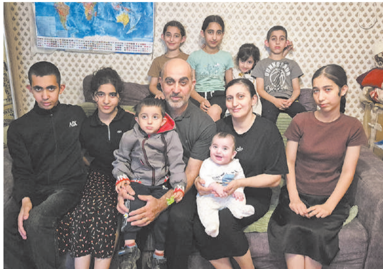
Вместе дружная семья!