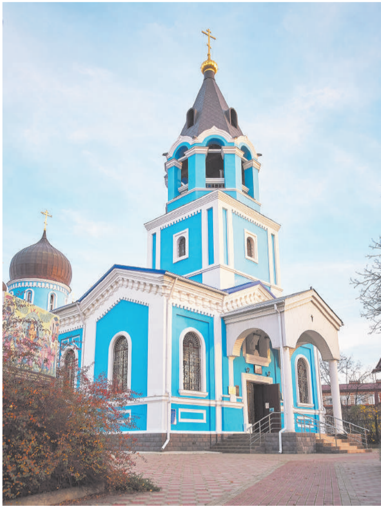
Соборный храм Успения Пресвятой Богородицы г. Лабинска.

сюда. Месяц давайте, — рассказывает она.