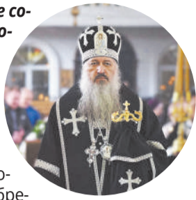
САВВА, епископ Армавирский и Лабинский

Желаю вам укрепляющей благодати Духа Святого, помощи Божией в трудах и заботах о вечном спасении и благоуукрашении святыни города Лабинска – соборного храма Успения Пресвятой Богородицы!