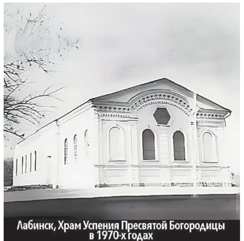
Лабинск, Храм Успения Пресвятой Богородицы в 1970-х годах

Особенно трагичными выдались дни декабря 1960 года, когда храм был превращен в клуб, а затем в спортивный зал рядом построенной общеобразовательной школы. В архивах