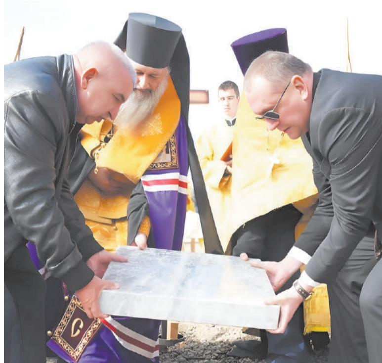
Закладка камня в основание нового храма.

А уже через год жители района вновь собрались здесь на молитву - в ноябре 2025 года строящийся храм увенчали золотые купола с крестами. В по-