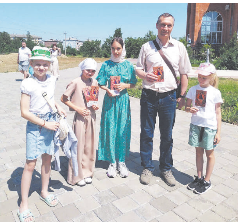
* Всей семьей на службу!

Такие дни остаются в памяти надолго. Они воспитывают любовь к Церкви, ощущение общности и ра-