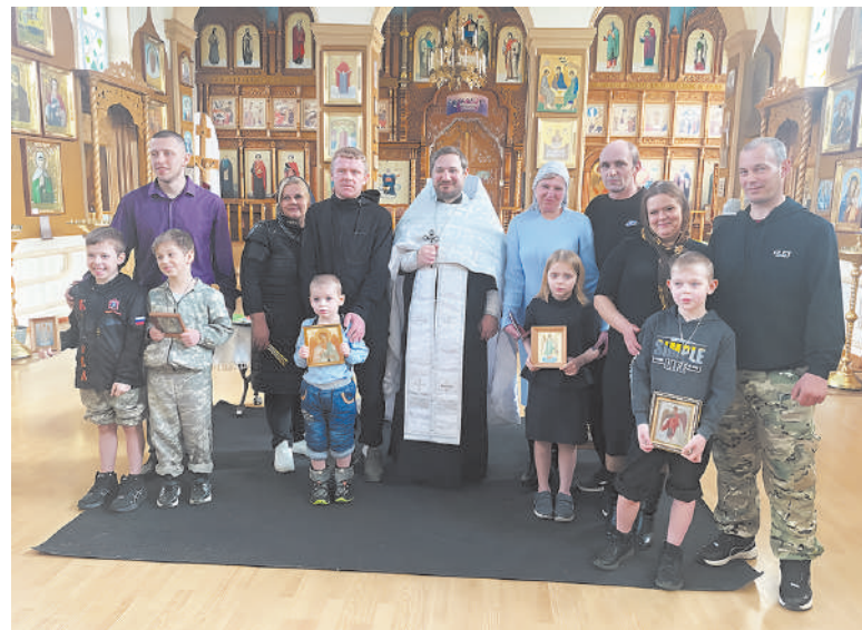
* С казаками и казачатами Маламинского ХКО.