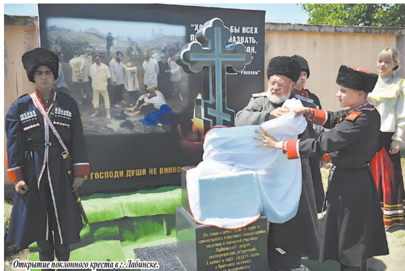
* Открытие поклонного креста в г. Лабинске.

Как к атаману Лабинского городского казачьего общества, ко мне обратились казаки и жители города с просьбой установить памятный знак. Я обратился в общественный Совет города, где нашел понимание и поддержку. Лишь представители компартии были против, но, к счастью, они оказались в меньшинстве. На общественном Совете было принято решение создать рабочую группу и собрать документы, подтверждающие то, что действительно на этом месте проходили эти ужасные преступления. В архивах города Лабинска, Армавира и Краснодара таких документов не было, власть Советов тщательно скрывала свои престу-