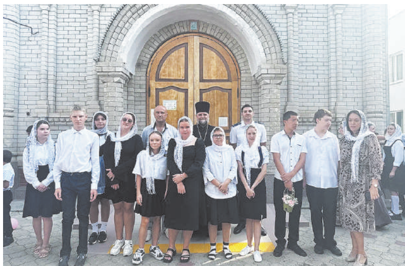
* Дружная духовная семья у стен родного храма.

– В день Александра Невского мы приезжаем в город Армавир на крест-