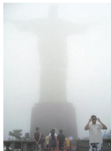
* Статуя Христа в тумане...

Туман висит над всей Корковадо. Казалось, день потерян. И вот, наконец, привезли просфоры. И как только началось богослужение, только зазвучал хор — туман как рукой сняло. В одно мгновение открылась вся гора. Вертолет тут же поднялся в небо. И в этот момент туман начинает рассеиваться, и появляется огромная статуя Христа, раскинувшего руки над городом. Служба тогда прошла на одном дыхании. Все получилось даже лучше, чем планировали. А после ко мне подошел